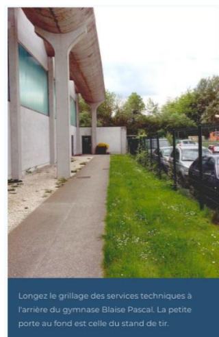
Longez le grillage des services techniques à l'arrière du gymnase Blaise Pascal. La petite porte au fond est celle du stand de tir.