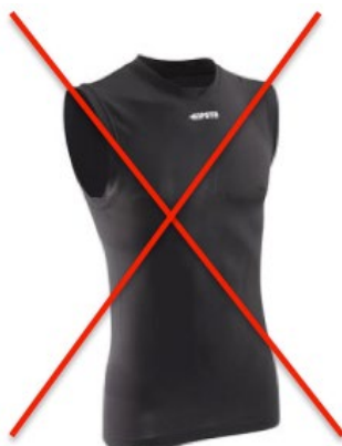
Ne recouvre pas les épaules