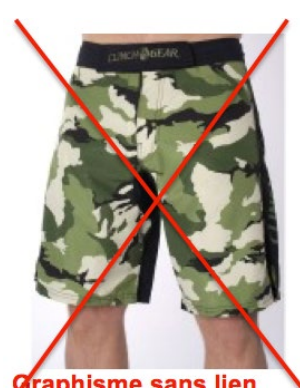
Graphisme sans lien avec la lutte