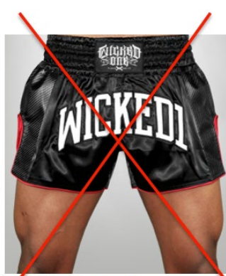
Short trop court