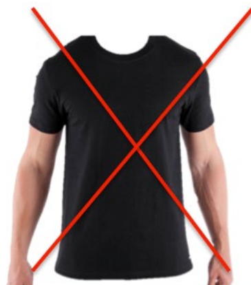
Pas assez collant et coton