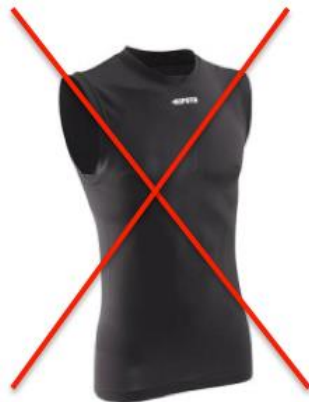
Ne recouvre pas les épaules