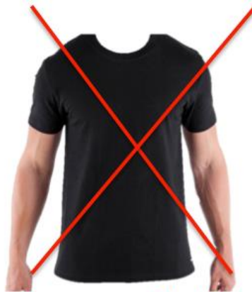
Pas assez collant et coton