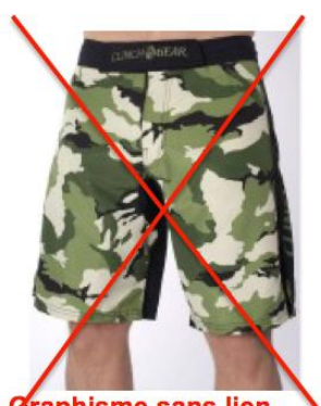
Graphisme sans lien avec la lutte