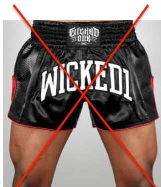
Short trop court