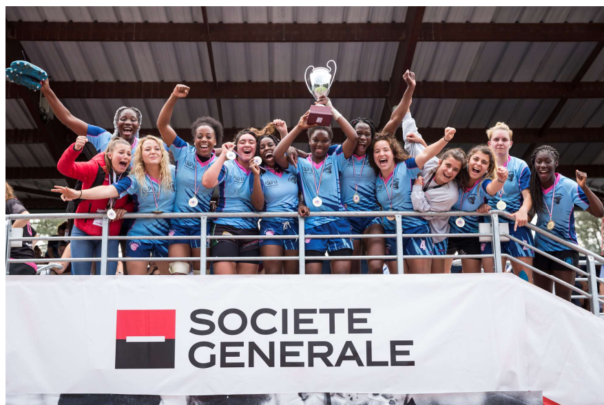
L'Université Paris 13, vainqueurs du SGSevens 2018, catégorie Elite féminines

Agrocampus Ouest Centrale Supélec EIGSI La Rochelle ENTPE Lyon ICAM Paris Senart INP Grenoble INP Toulouse INSA Lyon (1) INSA Lyon (2) INSA Toulouse Université Paris Dauphine Université Technologie Troyes