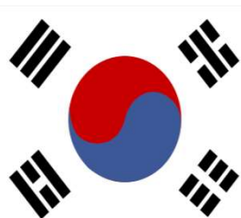
Corée du Sud