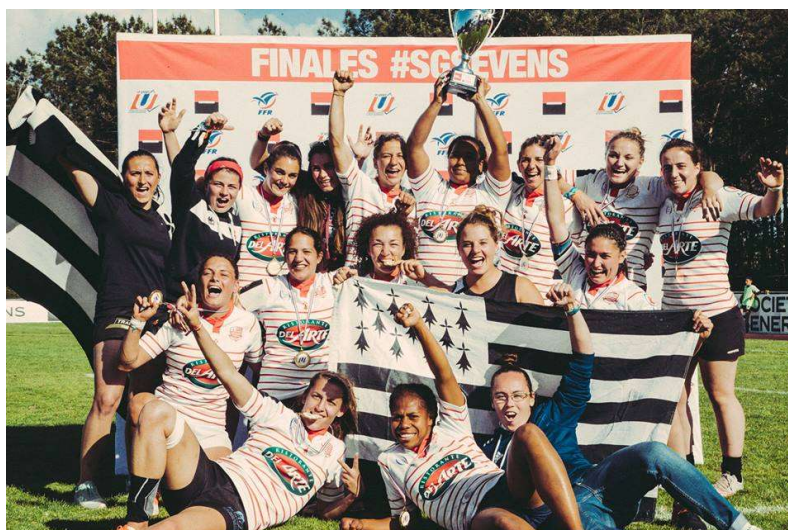
L'Université Rennes 2, vainqueurs du SGSevens 2017, catégorie Elite féminines

Agrocampus Ouest Centrale Supélec EGS La Rochelle ICAM Lille INP Bordeaux INP Grenoble INP Toulouse INSA Lyon (1) INSA Lyon (2) INSA Toulouse Université Paris Dauphine Université Technologie Troyes