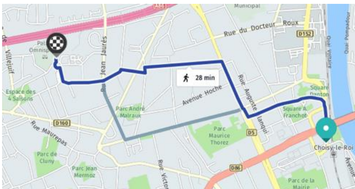
Trajet de la gare RER la plus proche du palais omnisports.